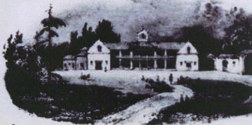
Notice sur l'école préparatoire de Mettray (Indre-et-Loire), 1853.

À partir de la fin du XIX e siècle se met en place toute une législation concernant la protection des enfants maltraités et abandonnés. Sous l'influence des législations étrangères, la loi du 22 juillet 1912 reconnaît les grands principes qui organisent le système français, préfigurant ainsi la protection judiciaire de l'enfance délinquante. Elle instaure les tribunaux pour enfants. L'ordonnance du 2 février 1945 crée les juges des enfants. La priorité est donnée à la voie éducative sur la voie répressive. L'ordonnance du 23 décembre 1958 relative à l'enfance en danger étend l'intervention du juge des enfants et de la Protection judiciaire de la jeunesse auprès des mineurs dont la santé, la sécurité ou la moralité sont en danger. Plus récemment, les centres éducatifs renforcés reçoivent les jeunes délinquants pour une prise en charge éducative en hébergement. Il s'agit de leur permettre de reprendre contact avec la vie sociale par des activités diverses et d'élaborer un projet de re-socialisation.