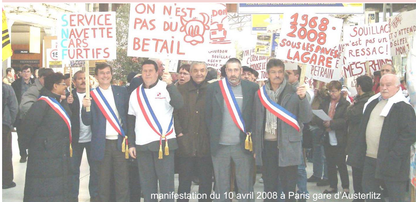
manifestation du 10 avril 2008 à Paris gare d'Austerlitz

Cela n'a pas empêché la Préfète d'entériner ces projets. Tous ensemble nous ne nous laisserons pas faire. Nous ne sommes pas des citoyens de seconde zone. Nous le ferons savoir !