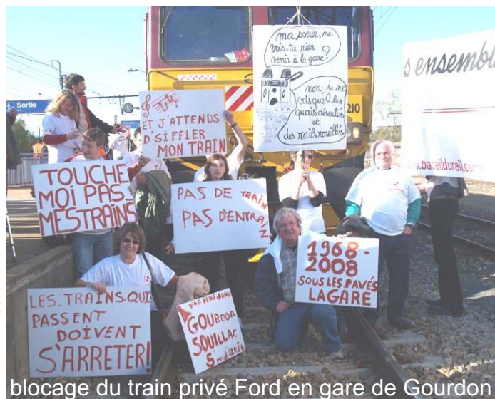
blocage du train privé Ford en gare de Gourdon

notre région, ayant besoin du réseau Fret, sont menacées et cela pose la question de l'aménagement du territoire et de l'emploi en zone rurale. Suite à la fermeture, des 15 gares, au Wagon isolé sur notre secteur 41000 tonnes sont transférées vers la route rien que pour le département du Lot.