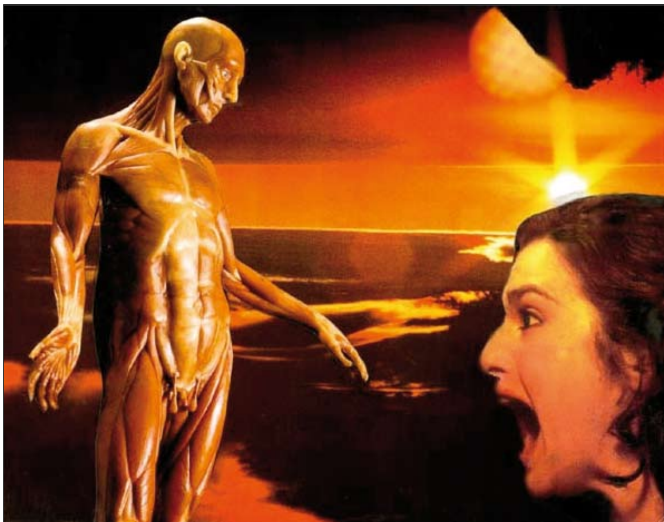
Cadeau de mariage par M. Le.