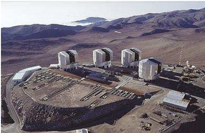
Télescope VLT (Very Large Telescope)

qui étaient réellement les visiteurs du premier vaisseau ?