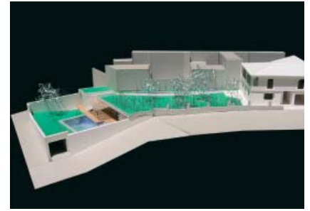
L'EXTENSION S'INSRIT ENTRE LES LIGNES DE NIVEAU