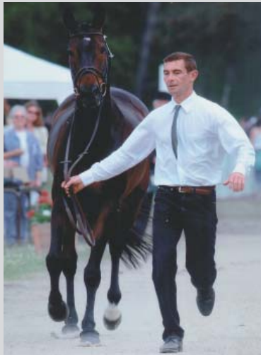
Visite vétérinaire, CCI*** Saumur 2006