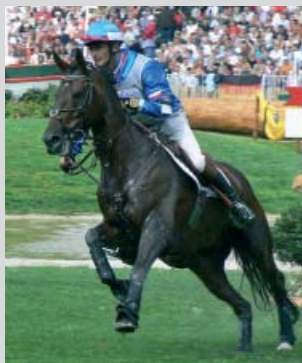
Cross, Championnat du Monde, Aachen (ALL) 2006