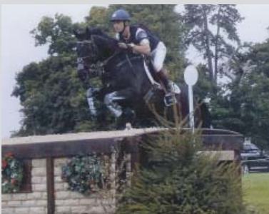
Cross, CCI*** Blenheim (GB) 2007