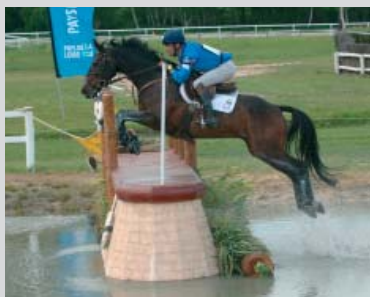
Cross, CCI*** Saumur 2006