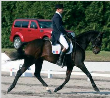
Dressage, CCI**** Pau 2007