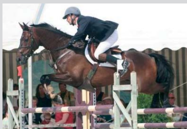
CSO, CIC*** Vittel 2007