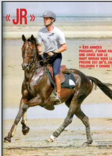
Mag. L'Eperon (Aout 2007)