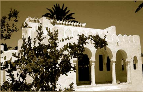
Member of the Tingitingi Project