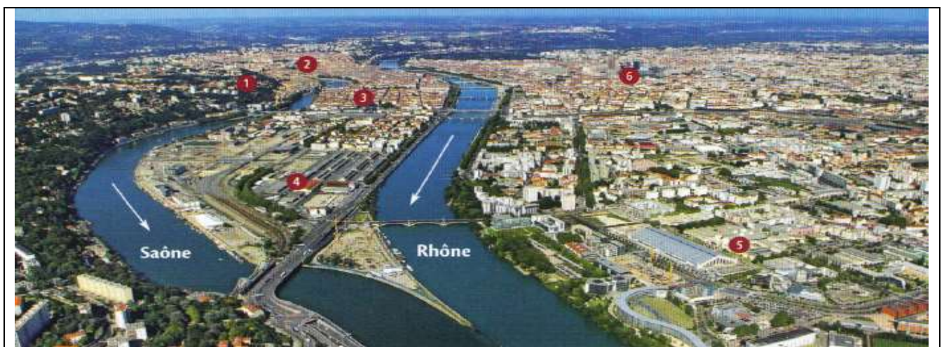
1 Fourvière 2 Croix-Rousse 3 Place Bellecour 4 Nouveau quartier Lyon Confluence 5 Gerland 6 La Part-Dieu