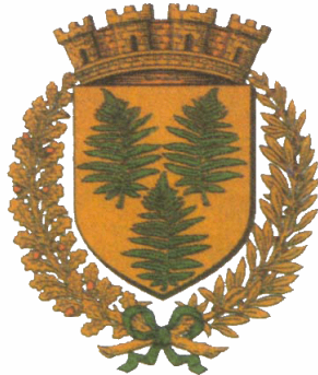
Ville de Mortagne au Perche