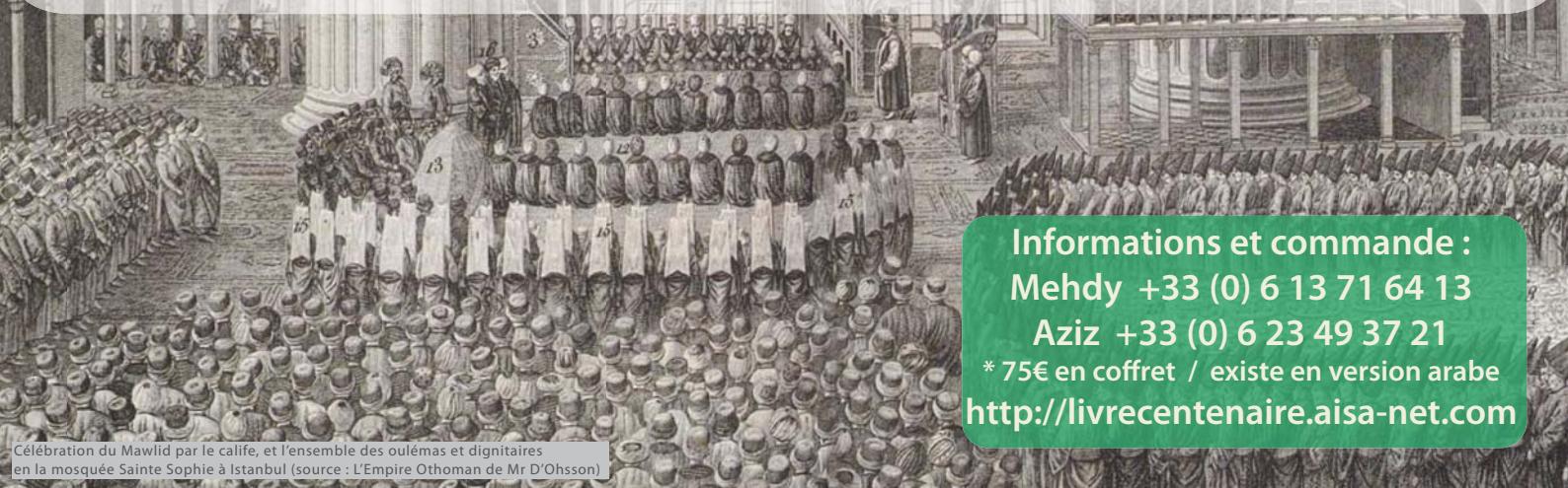
Célébration du Mawlid par le calife, et l'ensemble des oulémas et dignitaires en la mosquée Sainte Sophie à Istanbul

Informations et commande : Mehdy +33 (0) 6 13 71 64 13 Aziz +33 (0) 6 23 49 37 21 * 75€ en coffret / existe en version arabe http://livrecentenaire.aisa-net.com