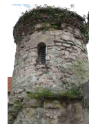
peut-être une tour (la dernière) de 1588, sur l'emprise du château