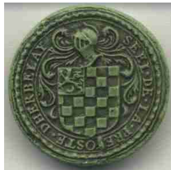
Dès 1666 et au XVIII e Seel de la prévosté d'Herblay