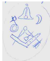
1790-1793 cachet (croquis GF)