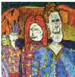
Ozoz addict - Peintre