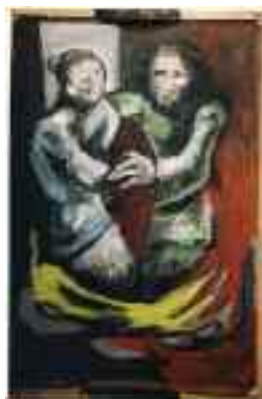
Hervé Fogeron - Peintre