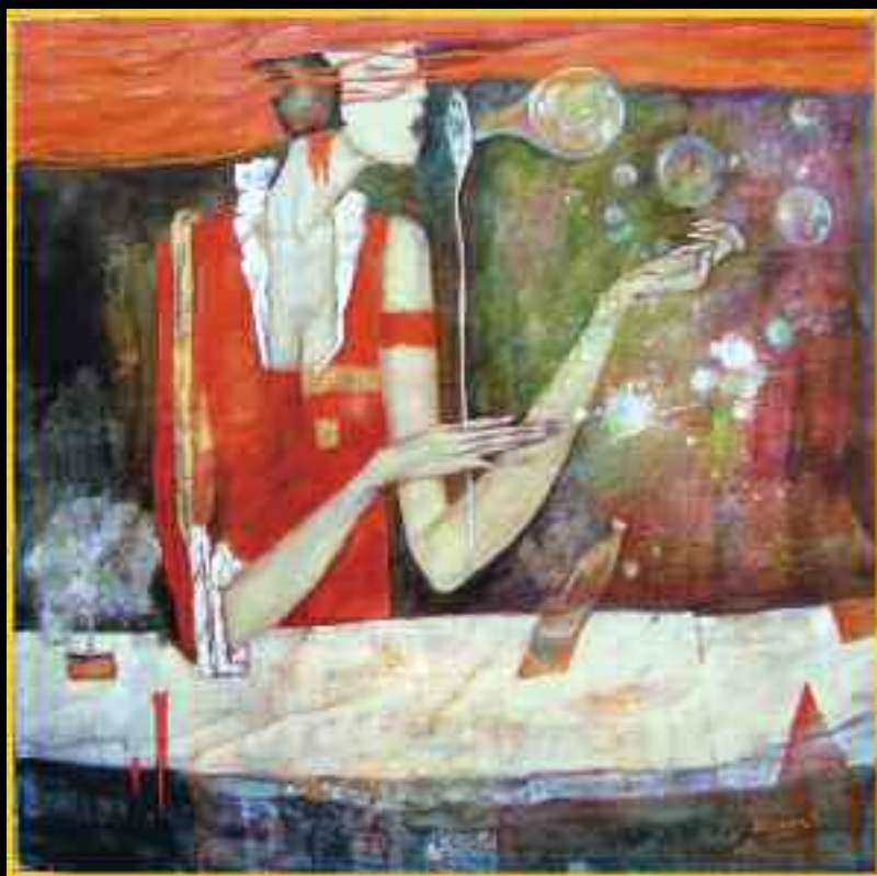
illustration de couverture : Serge Tsiganov - impression : I.D.O. St Marcellin en Forez