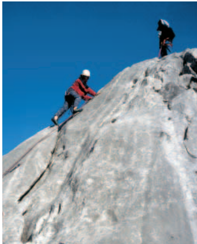
L'école d'escalade du Pas de Lovenex