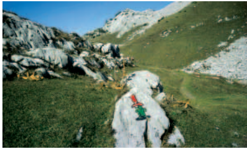
Au Pas de Lovenex, des jalons originaux indiquent la direction des rochers d'escalade, par ailleurs bien visibles