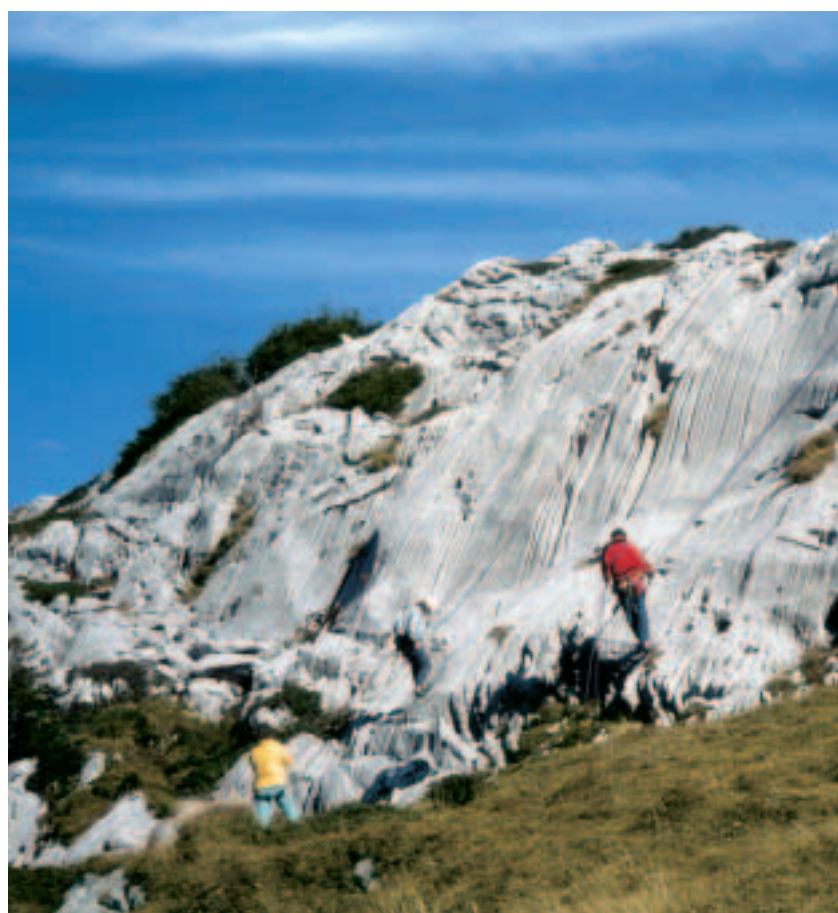
Le site d'escalade du Pas de Lovenex