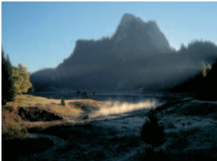
Ambiance matinale d'automne au lac de Taney; à l'arrière-plan, Le Tâche