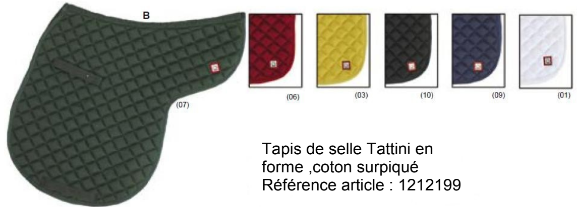
Tapis de selle Tattini en forme ,coton surpiqué Référence article : 1212199

En toile matelassée, élastique, boucles à rouleaux. Coloris : marron (04) - noir (10) Longueur : 70 à 140cm