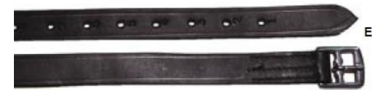
Etrivières simples en cuir Référence article : 1150499

Coloris : vert (07) - rouge (06) - jaune (03) - noir (10) – marine (09) - blanc (01) Taille : cheval