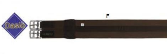
Sangle Référence article : 1101221

En suédoise. Arcade d'arçon interchangeable. Coloris : Gris/noir (08) Tailles : 17" et 18"