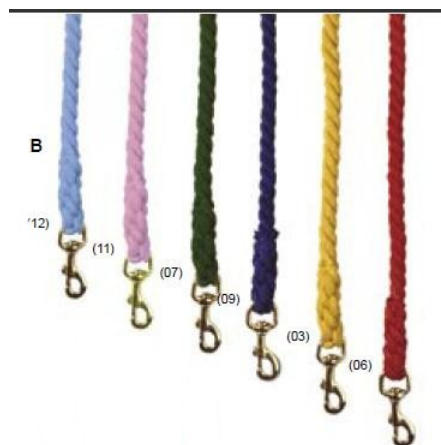
Longe en coton torsadé Référence article : 2100299

En PVC souple et solide bords contrastés, rênes caoutchouc couleurs contrastées. Coloris : noir (10) – marron (04) – bleu (14) – rouge (06) – orange (33) - bleu ciel(12) - fuschia (65) Tailles : Full – Cob -poney