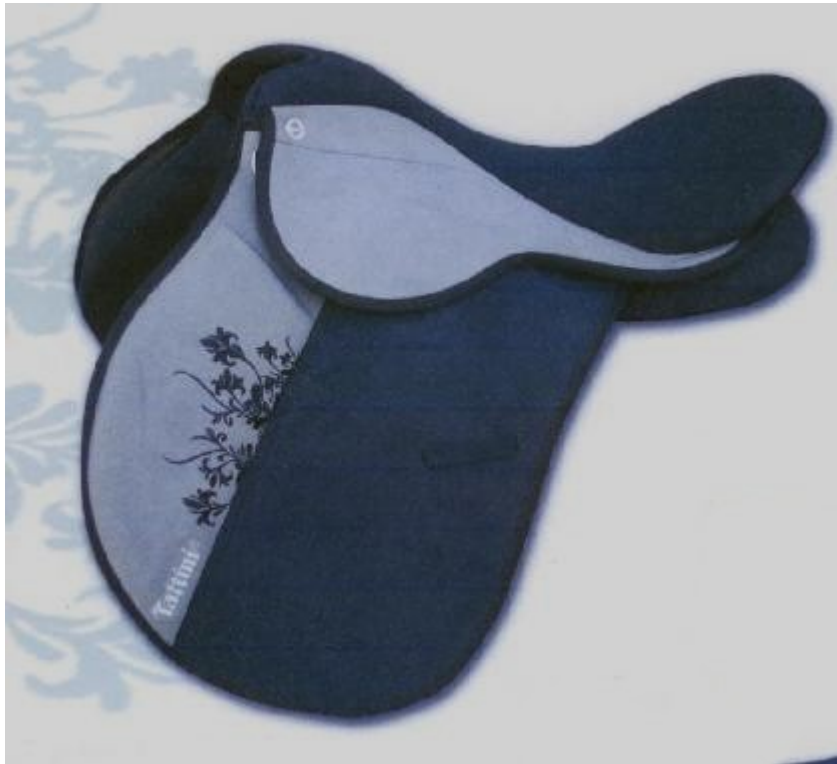
Selle Daslo bicolores brodées. Référence article : 1047499

En suédoise. Arcade d'arçon interchangeable. Coloris : Gris/noir (08) Tailles : 17" et 18"