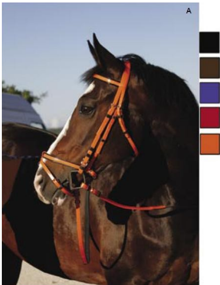
Bridon Daslo en PVC, rênes caoutchouc Référence article : 1401424

En PVC souple et solide bords contrastés, rênes caoutchouc couleurs contrastées. Coloris : noir (10) – marron (04) – bleu (14) – rouge (06) – orange (33) - bleu ciel(12) - fuschia (65) Tailles : Full – Cob -poney