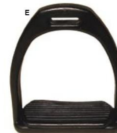
Etriers synthétiques adulte Référence article : 1308399

Etriers synthétiques légers, semelles caoutchouc. Coloris : noir (10) Taille : 12cm