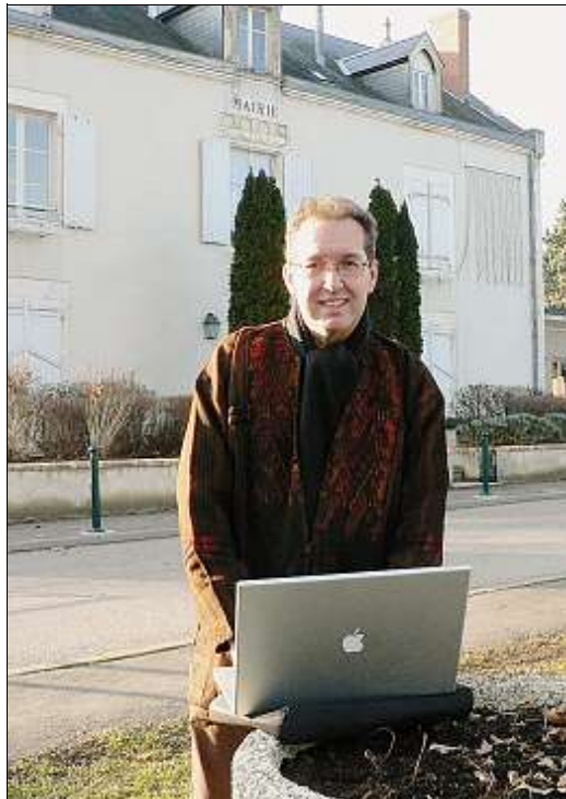
AVATAR. Elle court, elle court toujours la parole à Herry, en toute liberté. Elle a juste changé de canal de diffusion.