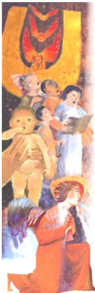
La Nativité, par ARCBAS.