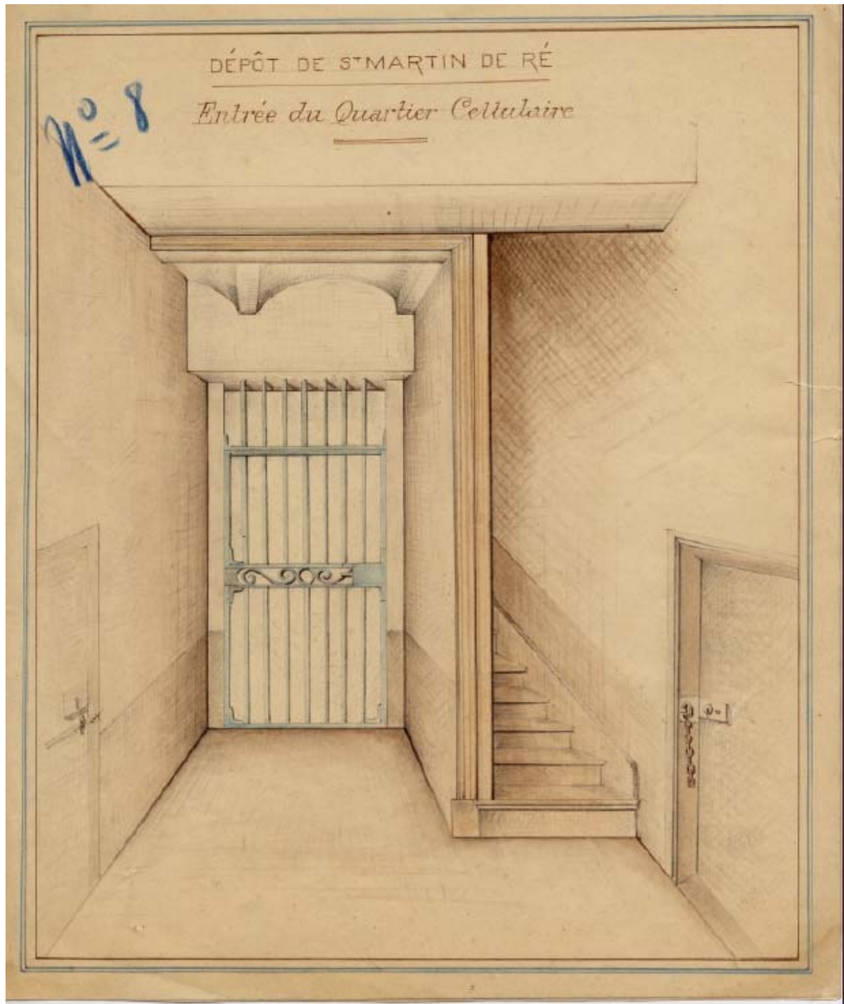
Dessin de bagnard 2