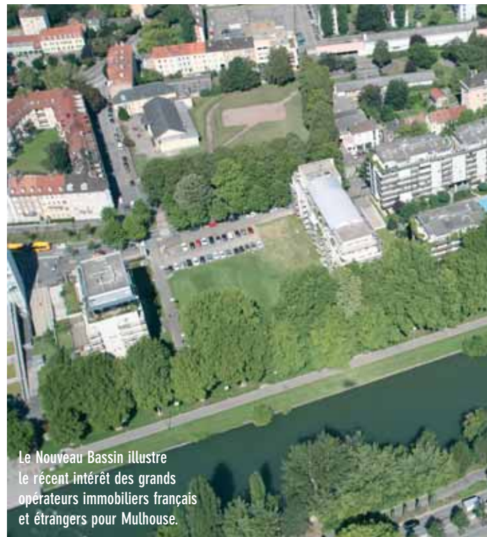
Le Nouveau Bassin illustre le récent intérêt des grands opérateurs immobiliers français et étrangers pour Mulhouse.