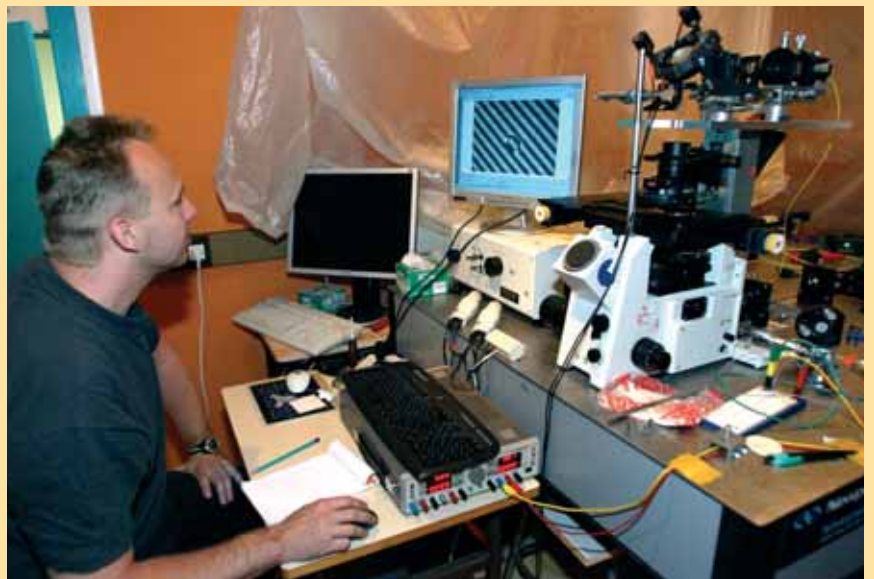
Le laboratoire de l'École nationale supérieure d'ingénieurs Sud Alsace (Ensisa) s'est doté d'équipements de pointe pour la recherche sur la photonique.