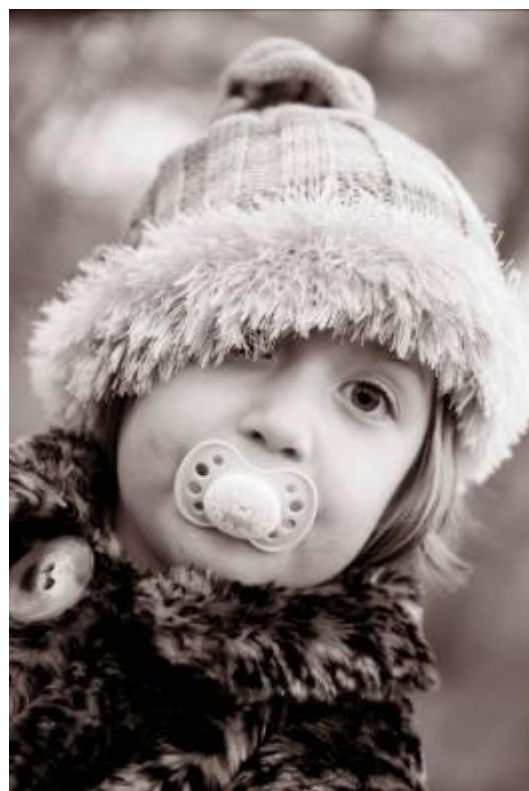
Photo réalisée par un jour d'hiver